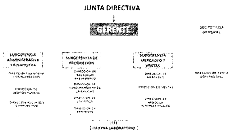
Figura 1. Estructura.

La Fábrica de Licores y Alcoholes de Antioquia EICE, creada por medio de la Ordenanza No. 19 del 19 de noviembre de 2020, a través de la Junta Directiva adoptó su estructura por medio del Acuerdo No. 005 del 21 de diciembre de 2020, a saber: